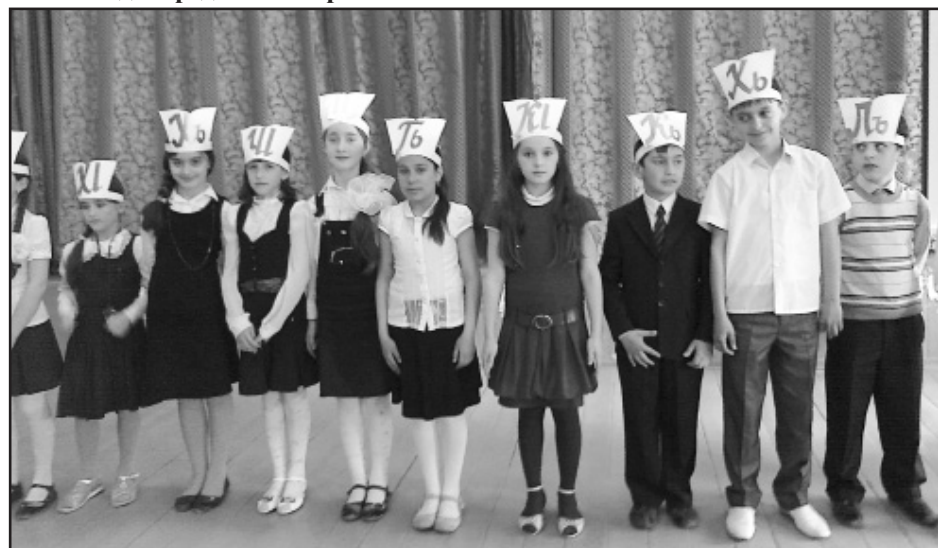
День аварского языка в школе №6 города Каспияска.