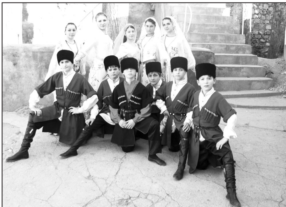
Первый Республиканский фестиваль аварского языка в Гергебиле. Команда города Кизилюрта