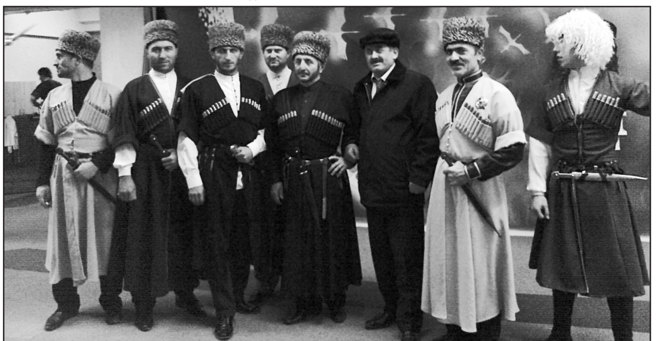
День памяти Великого ИМАМА ШАМИЛЯ