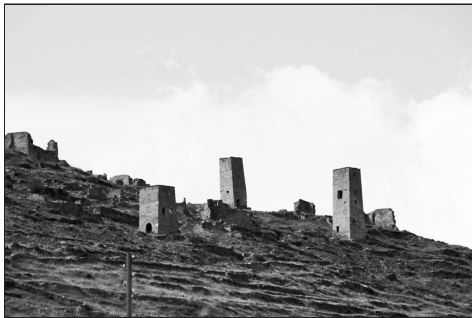
Басрияб Гьоор росу

К 300-летию со дня рождения и 220-летию со дня смерти Абубакархаджи Аймакинского