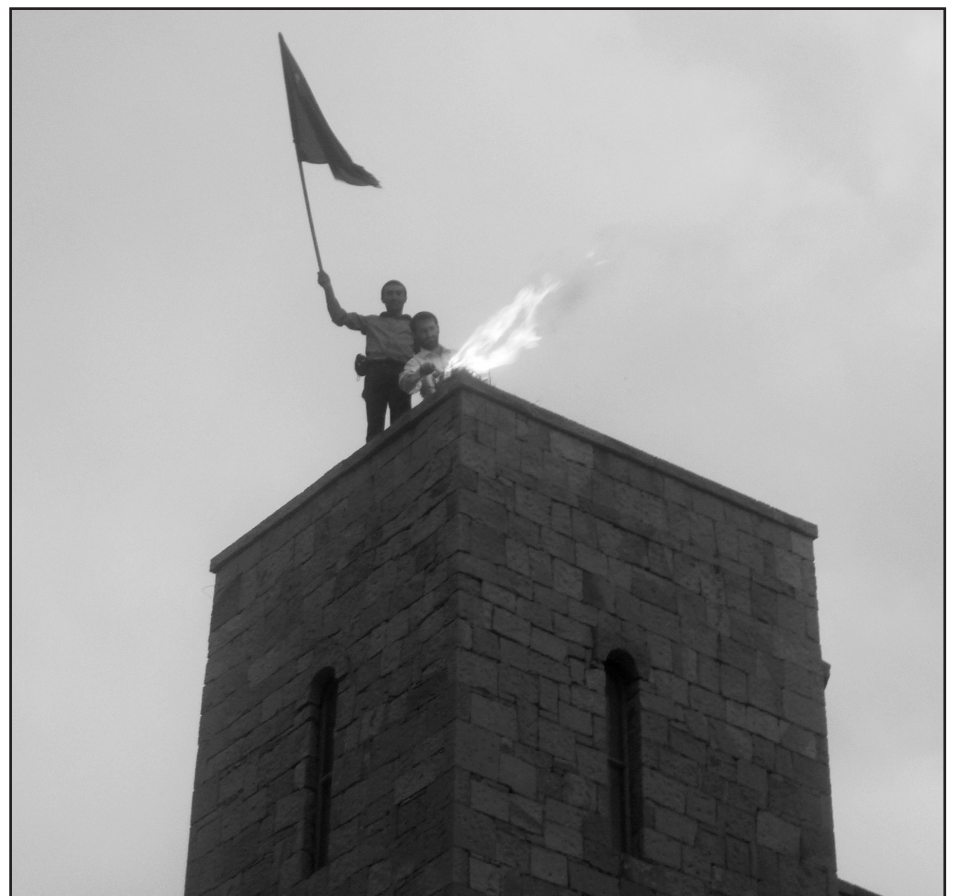
«СИГНАЛЬНЫЙ КОСТЕР - 2010