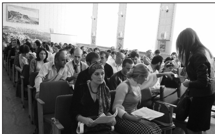
Конференция в честь «Дня единения Дагестана» и акции «Сигнальные костры»