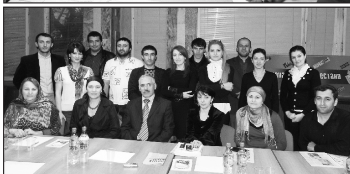
«Содействие сохранению аварского языка»