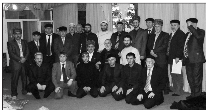
«День Памяти Имама Шамиля»