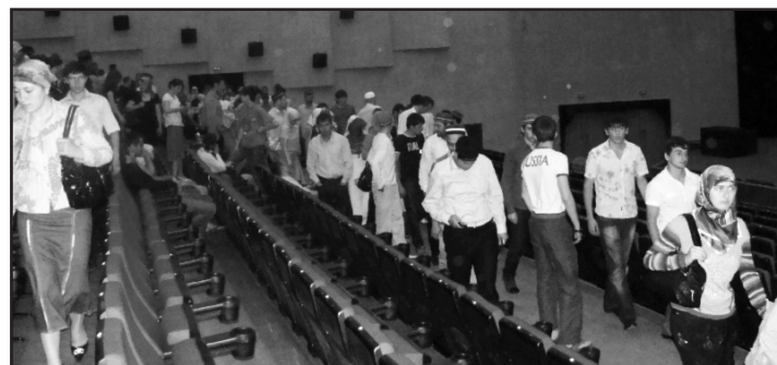
«Эхо кинофестиваля «Золотой минбар»