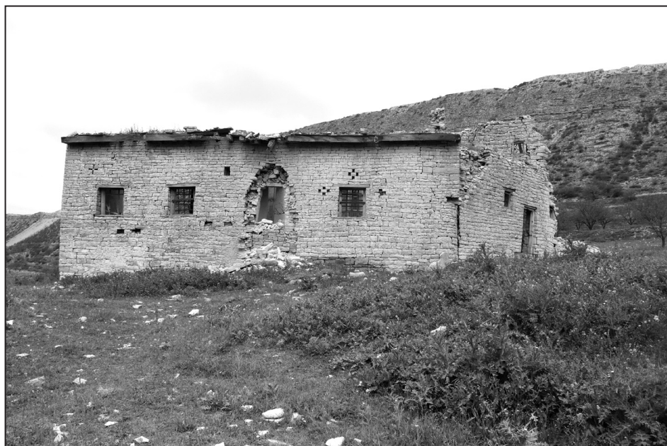
Старинная мечеть, построенная более 200 лет назад. Окрестности селения АХАТЛЫ Буйнакского района

Мемориальный комплекс „БАТАН“, построен в местечке Хициб, на месте разгрома армии Надиршаха. Селение Согратль Гунибского района