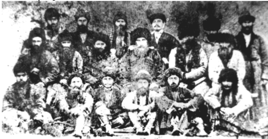
Къокъаб шаригІаталъул церехъаби чІваледе цере