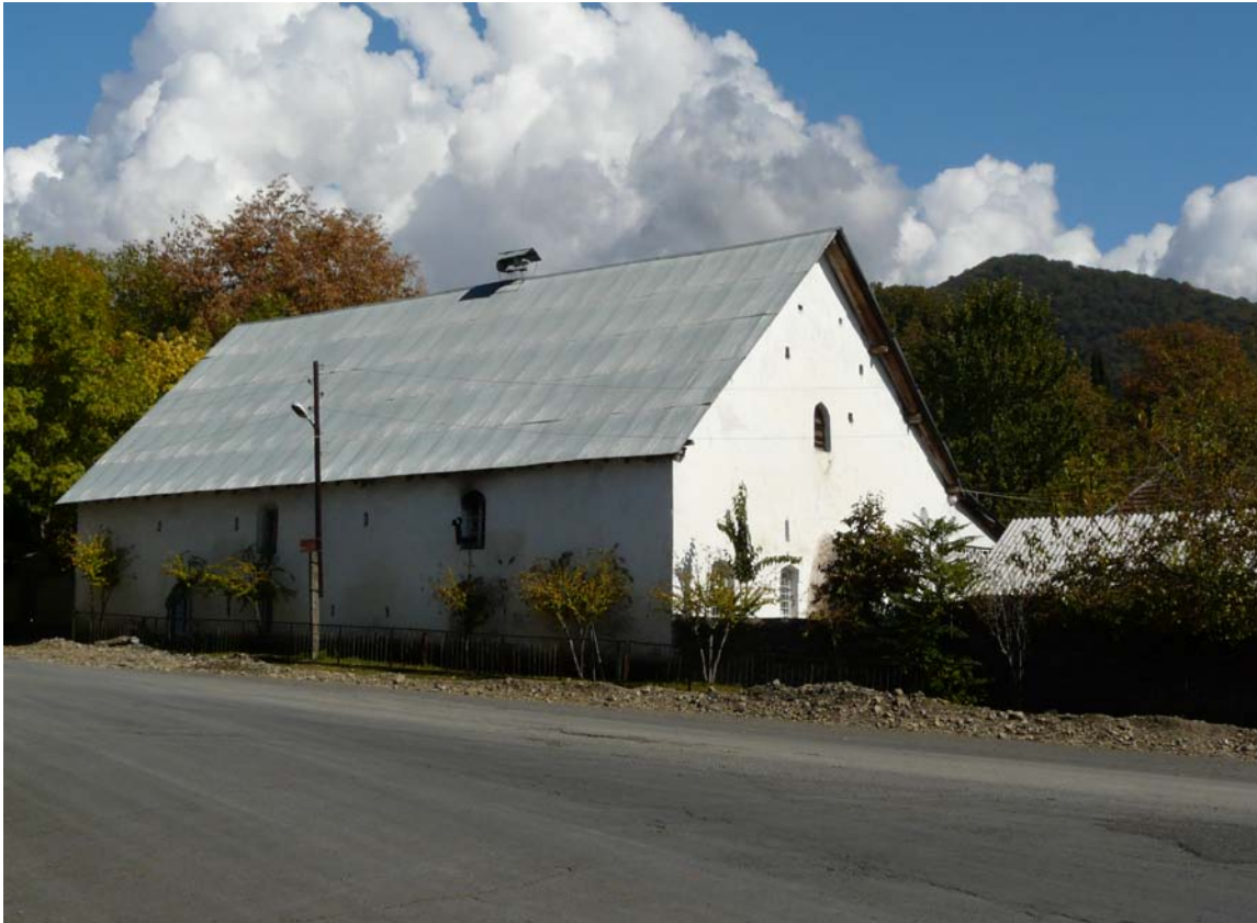
Джума-мечеть сел. Джар (XVII в.).

Во время сбора полевого материала нами была сделана попытка исследовать ряд эпиграфических памятников с. Джар. Хотя исследованные нами памятники представляют собой более поздний период и выходят за рамки нашей работы, мы включили их в наше исследование. Наиболее ранний, его можно датировать приблизительно 1785 годом. Есть и надписи более позднего периода. Исследованные нами надписи в основном датируются конце XIX столетия. Вот некоторые из них: