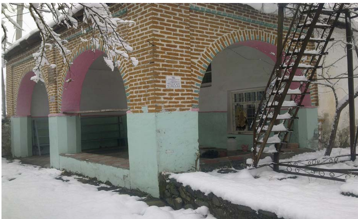
Мечеть XIV в. с. Катех. Белоканский район.

В надписях и эпитафиях XVII-XX вв. встречаются имена деятелей ислама, показывается их роль в общественной, религиозной и культурной жизни народов данного региона. Немаловажную роль играют надписи в изучении социально-экономической жизни народов; некоторые из них представляют ценные материалы, касающиеся административного деления, вакуфных земель и др. В надписях встречаются имена правителей, купцов, полководцев, а также имена мастеров – строителей, зодчих, каллиграфов, медников, резчиков и т.д. Строительные надписи на зданиях мечетей и на других религиозных памятниках, построенных в этот период, включали выдержки из Корана и хадисов, которые высекались на арабском языке. Каллиграфы, мастера-резчики, орноменталисты данной зоны были тесно связаны с мастерами соседних областей, в том числе и с ширванскими мастерами художественной резьбы. Они владели не только арабским языком, но и поэзией. Идеи ислама