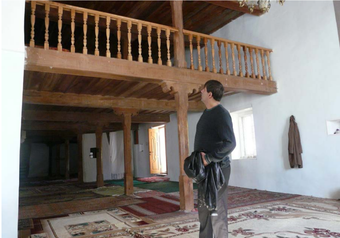
Интерьер мечети с. Джар после восстановления.

Арабоязычная литература и культура народов восточных стран не только проникали в регион, но и глубоко усваивались местной культурой. «Творческое усвоение письменных памятников культуры, созданных народами Востока, имело здесь, свое логическое продолжение, опираясь на достижения других народов. Здесь были впервые созданы местные исторические хроники на арабском языке» 143 .