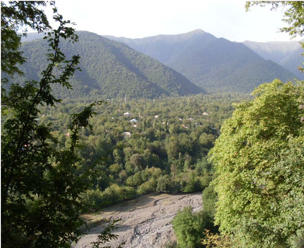
Вид села Джар.

Общинное землепользование в XVIII в. существовало как в вольных аварских, так и в зависимых – кешкельных (ингилойских и мугальских) селениях. Разложение тухумного строя в вольных обществах вызвало и разложение общинного землевладения. К концу XVIII в. неразделенными остались только пастбища и леса (и то не везде), а пахотные земли, сады и виноградники находились почти повсюду в фактическом владении отдельных семейств. В большинстве аварских селений с распадом родового строя пахотные земли постепенно перешли во владение отдельных семейств (дымов), причем само владение превратилось в наследственное. В состав наследственного участка земли входили, помимо пахотных земель, усадьбы, виноградники и тутовые сады.