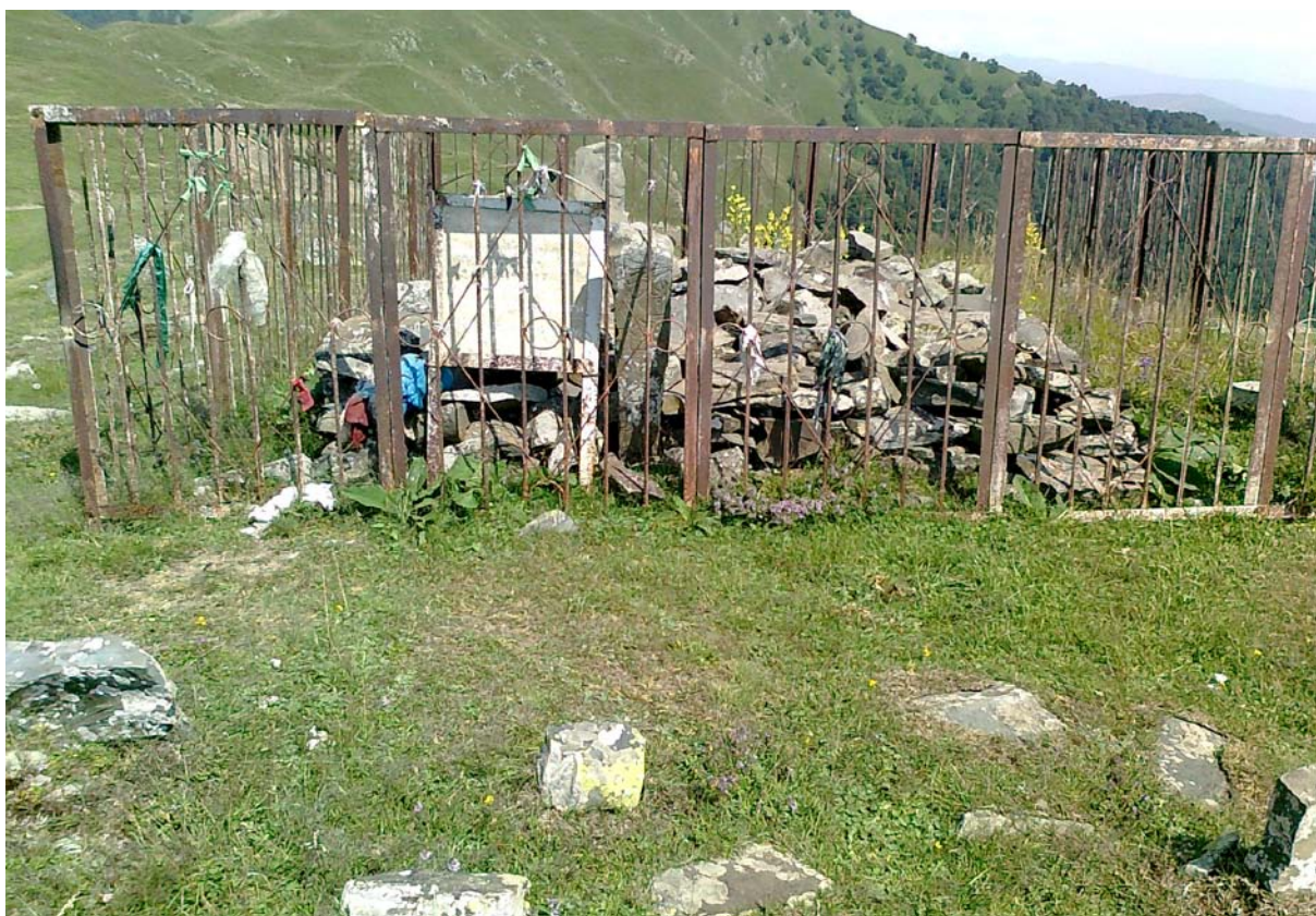
Могила религиозного предводителя Нухиязул Малла-Мухаммада на кладбище поселения Гьолода.

«Крестьяне переходили на сторону джарцев целыми селениями», – писал И. П. Петрушевский 125 .