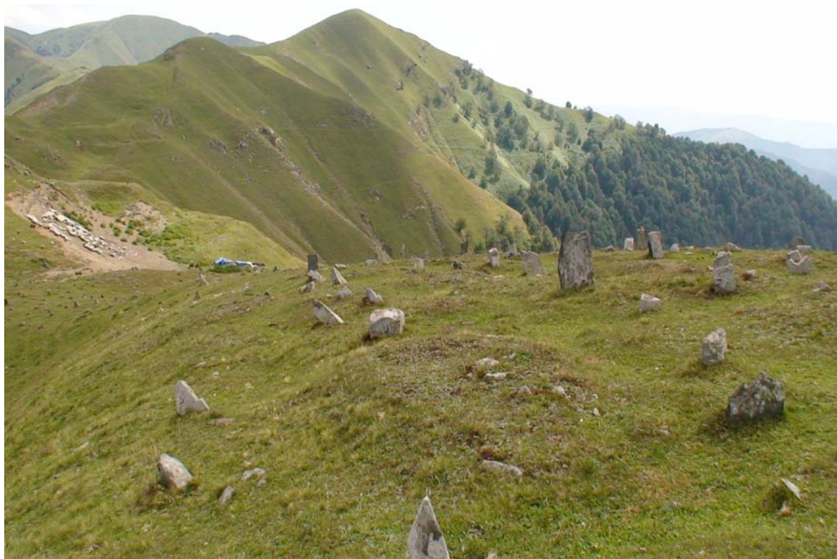
Старинный населенный пункт-Гъолода (западная часть).

мусульманским центром на Кавказе. Выходцы из Голода в XVII-XVIII вв. получают блестящее мусульманское образование в Бухаре, Самарканде и других городах мусульманского Востока.