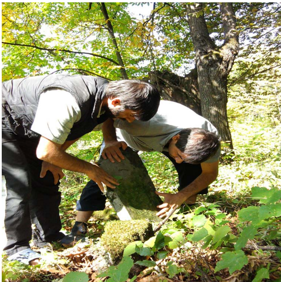
Полевая работа на одном из кладбищ сел. Джар.