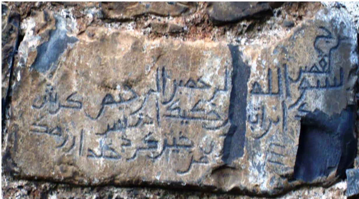
Арабоязычная надпись XIII в. на стене башни Джункоз-кала.

более позднего периода – начала XIII века) были обнаружены и в селе Джар Закатальского района в стене старинной башни Джункоз-кала 88 .