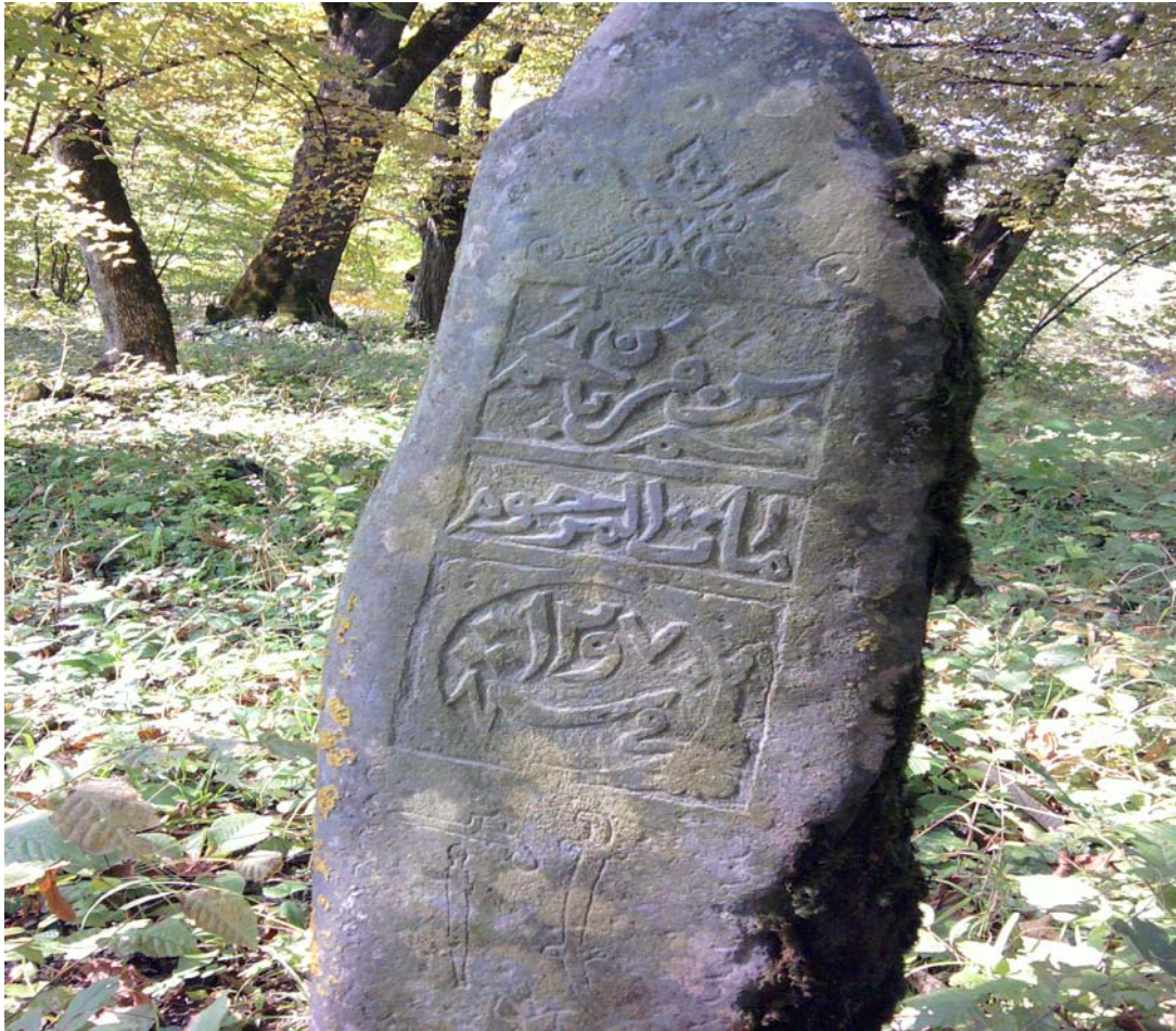
Надмогильная стела на кладбище Умумазул ахал (с. Джар).

Эпитафия содержит следующую запись: «Мухам бин Курбан бин Мухам. Умер покойный в 1298 по хиджре».