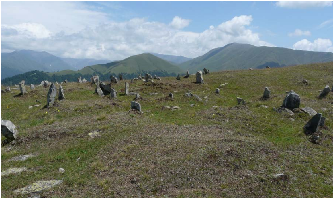
Кладбище старинного аварского поселения Гъолода.

Эти обстоятельства и привели к упадку грузинского господства в регионе. В грузинском источнике отражаются походы Тимура: «Тимур издал строгие повеления, чтобы отнюдь леки не учились ни чтению, ни письму на грузинском, и обязал леков учить арабский язык» 91 .