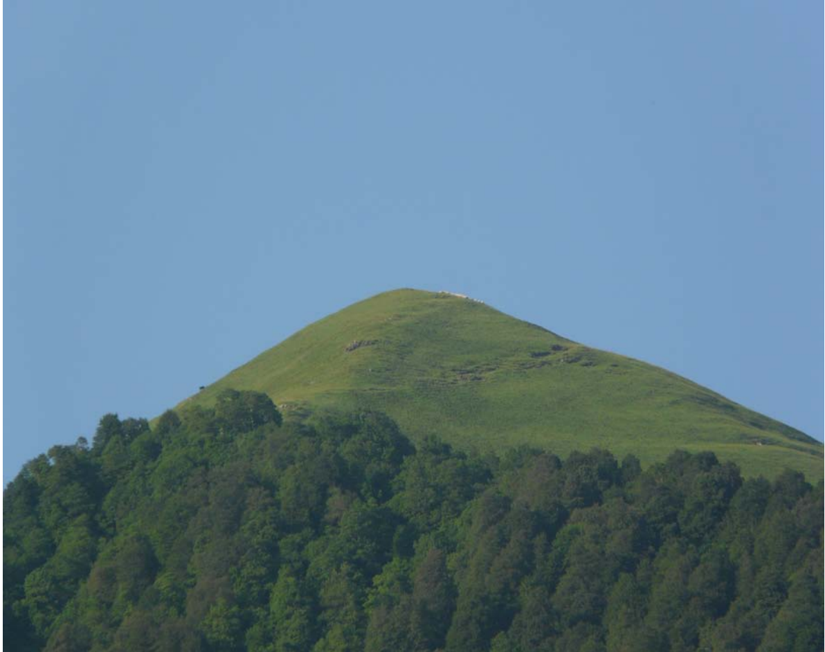
Горная вершина Эрасул меэр.

важную роль в формировании феодального общества Восточной Грузии. Эретия с грузинского языка переводится как «гора, стан, место эров» 51 .