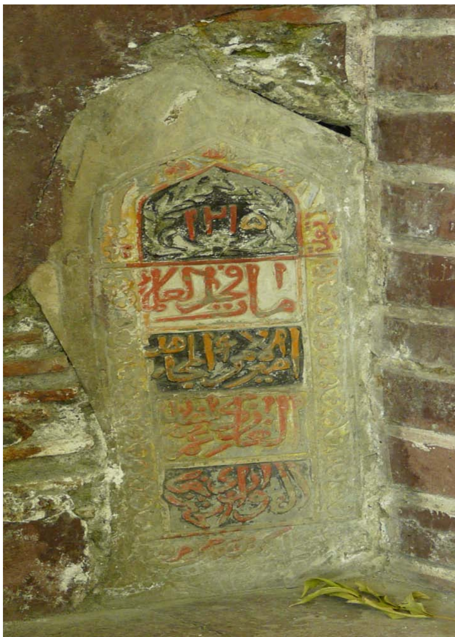
Надмогильная стела Уммахана Великого.