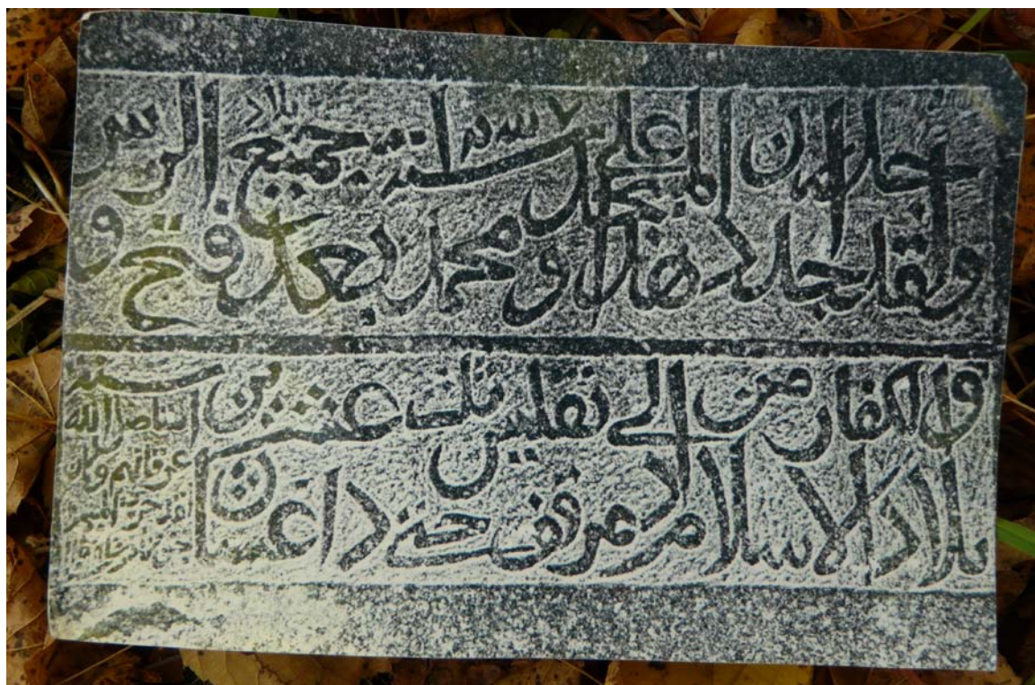
Настенная надпись цилбанской квартальной мечети.

Изучение сохранившихся памятников XVI-XVIII вв. данной зоны выявило такую закономерность: общее количество надписей XVIII века значительно превышает количество памятников XVI-XVII веков, которых можно разделить на два хронологических периода. Первый период охватывает XIII-XVII вв., а второй – XVII-XVIII вв. Однако такая периодизация носит лишь условный характер. По своему содержанию надписи данной зоны можно разделить на несколько групп: 1) надписи-эпитафии, 2) строительные надписи, 3) хроники. Преобладают же в общем количестве эпитафии. Во время сбора полевого материала нами было обнаружена арабоязычная надпись-эпиграфика.