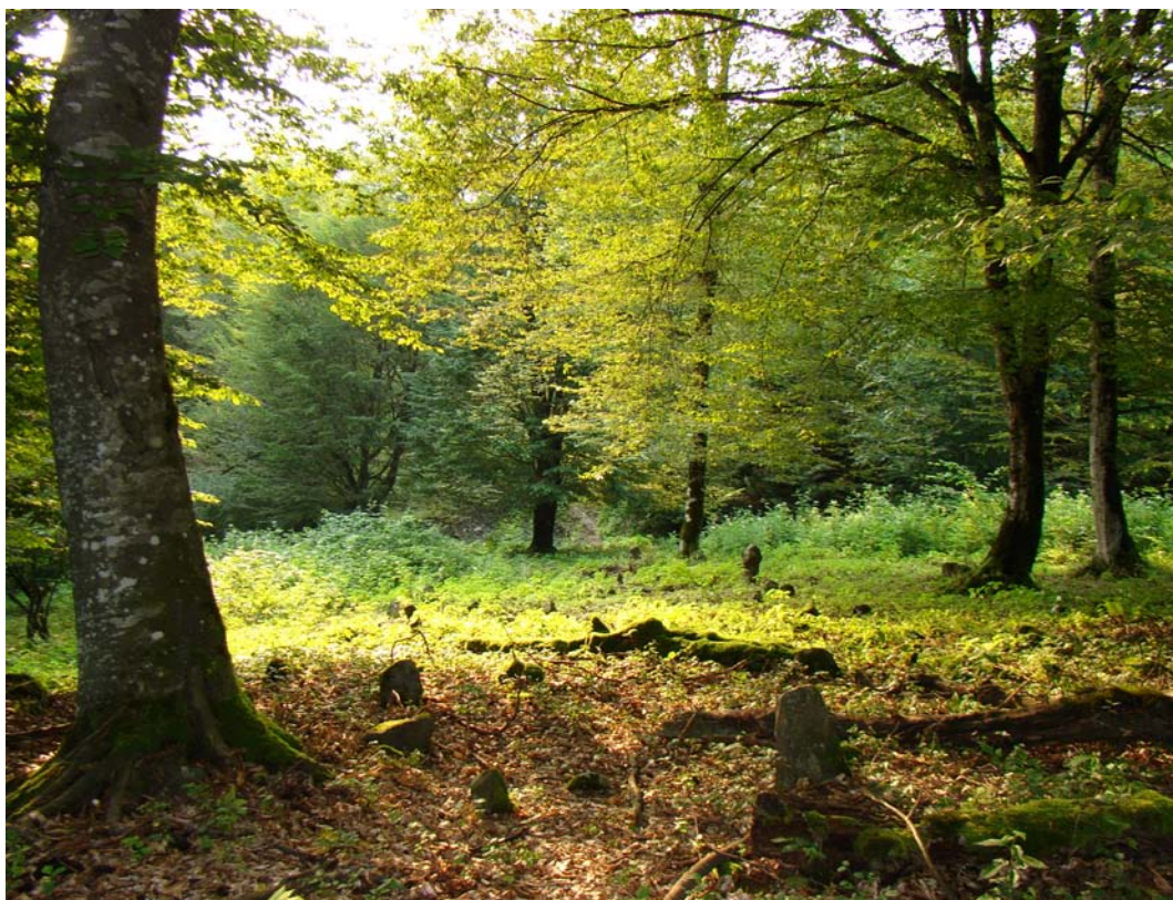
Местность, где было расположено старинное поселение Акаван.

религиозную систему – ислам. Бурные процессы, происходящие на рубеже тысячелетия в различных уголках нашей планеты, в большинстве своем связаны с исламом, который возник в VII веке в северо-западной Аравии.