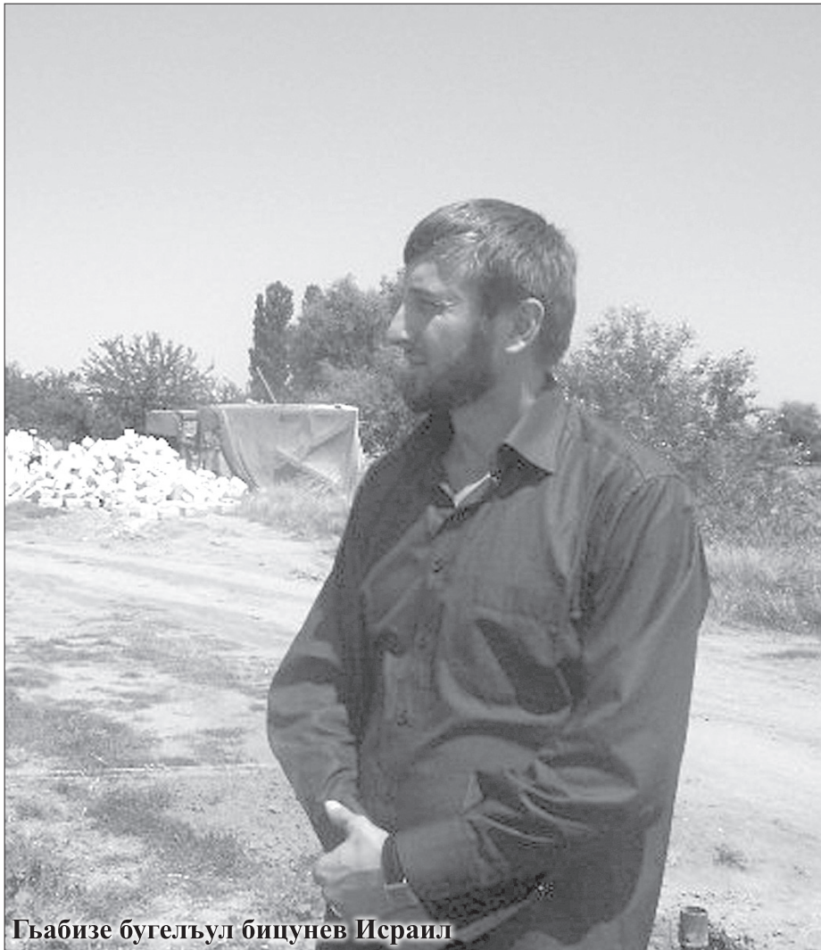
Гъабизе бугелъул бицунел Исраил

Щиб маг ишаталъул чи мун? Дир буклана исламияб ретлел