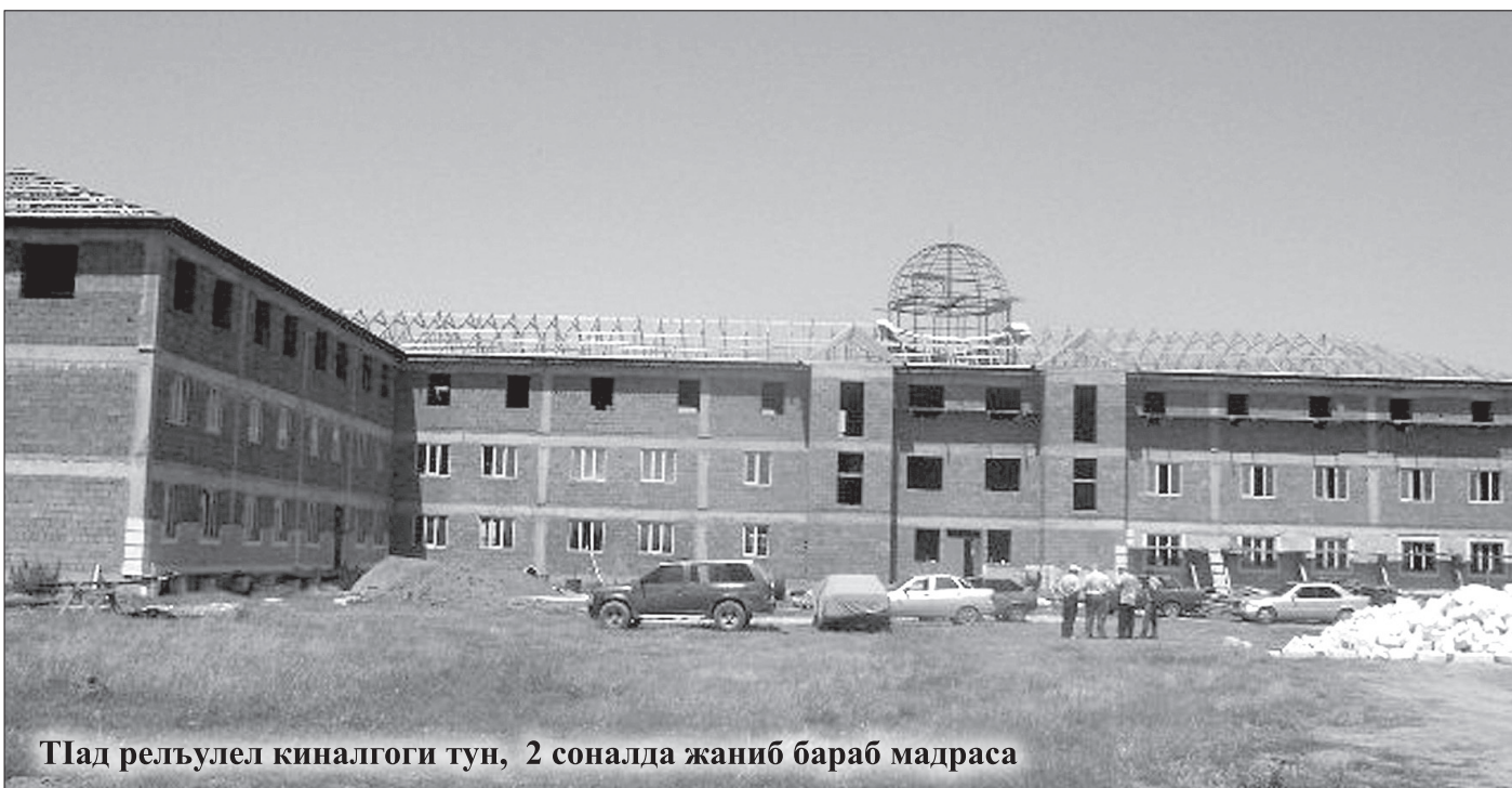
Тіад релъулел киналгоги тун, 2 соналда жаниб бараб мадраса

Гъез жидецаго тіаса бищизе бегула бокъараб. Исламалда хІал гъабун щибниги гъабизе тіамизе бегуларо. Бокъани, гъел цохІо мадрасаялда цІалун чІела, гъанибго гъезие щивасе махщел щвезабизе буго, бокъани цогиги цІалул идарабаздеги ине бегула. Аллагъас хъван батани, нижеда раклалда буго щибаб лъимадул цІаралда счет рагІизе. Бокъарав чияс лъезе бегула гъезул четалда гІарац. Лъимал балугълъиялде рахун хадуб гъезухъе къезе буго гъеб гІарац. КъваригІани цІалухъ къезеги, бокъани рукъ-бакІ босизе, хъизан гъабизе хІалтІизабизе бегула гъеб. Нижеда цебе бугеб аслияб масъала буго гъел лъимал лъикІлъиялдаса квешлѣи батІа бахъизе лъалел, рухІияб рахъ