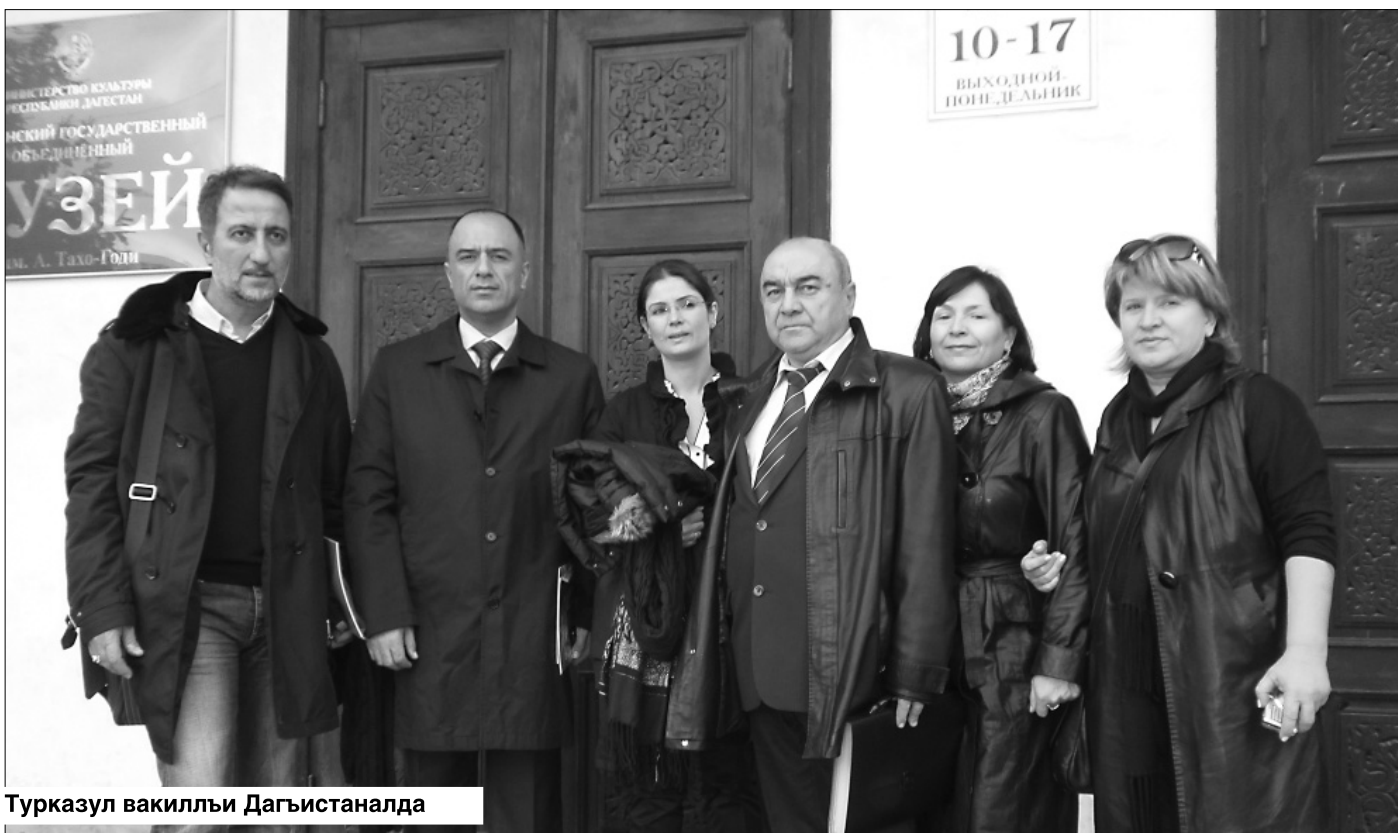
Турказул вакиллти Дагъистаналда

— Къадирбег, мун щвана Каспиялъул раглатлабазде, хлудеббахъиялъе рачлудеб шартлал глудиялде тладеги