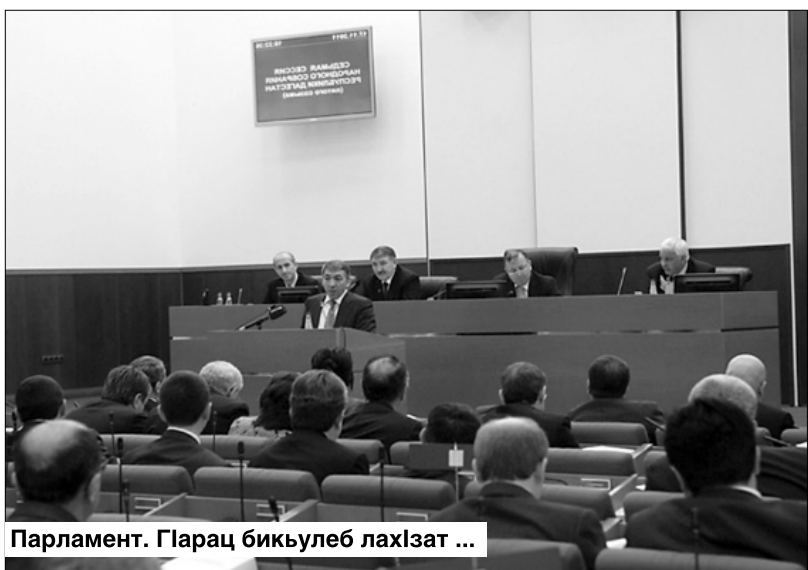
Парламент. ГIарац бикIулеб лахIзат ...

Г абсагIаталда буго хамиз кIоялзул бакIанил гIуж. ДагIав цева вуссана ХалкIияб Собранилзул сессиялдаса. Повесткалда рукIарал суалазул аспиябIун букIана иргадулаб 2012 абилеб соналIе республикалзул бюджет тасдикI гIаби. Докладагун цева вахIарав экономикалзул ва финансазул министрасул кIалIаял рукIана кидаго гIадин чIамучIал ва рачIинахIего гIенеккарав чIясда жанире унарел.