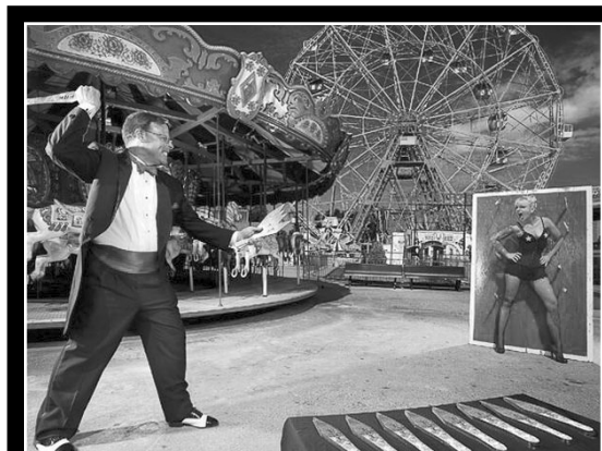
Девид Абрамовичица цо минуталда жаниб 102 нус речIчIана ясалда.