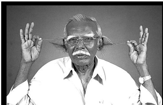
Индиялдаса Энтони Викторил гIундузда жаниб бижараб расул халалъи бахуна 18.1 см.