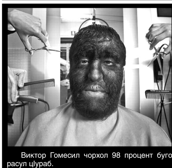
Виктор Гомесил чорхол 98 процент буго расул цIураб.