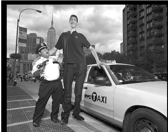
Дунялалда бицунго ворхатав туркав Султан Косенил логол борхалъи буго 246.5 см

Дагъав цевегIан 78 сонил ригъалда къадаралде цванин раIана, Аллагъас алжаналда даднде гъавегI. Дагъистаналда ругел ракъцояз ва гъесул гъудулзабаз къватIибе биччан буго Ражабил шигIрабазул тIехъ «ЦIороса баккараб бакъ» абураб цIаралда гъоркъ. Абиларо шигIрияб рахъалъ кутакалда пасихIаб ва гъваридаб тIехъ гъеб бугин. Амма гъеб цIакъго къимматалъун нильее лъугъунеб буго цIоралдаса бачIараб букIиналъ ва чияр бакIалда нильер ракъцояз Iасрабаца аваразул каламги, шигIру – кечIги цIунараб букIиналъ. Цо рекIелъ босу-леб гIадатлъи ва гугъар буго Ражабил шигIрабаль. Iагараб заманалда гъесул гъудулзабазда ракIалда буго миллияб библиотекаялда БацIазул Ражабил асаралгун къватIибе биччараб «ЦIороса баккараб бакъ» абураб тIехъалъул презентация гъабизе. «Миллат» газеталъ Iагараб заманалда лъазаби къела гъеб тадбиралда хурхун.