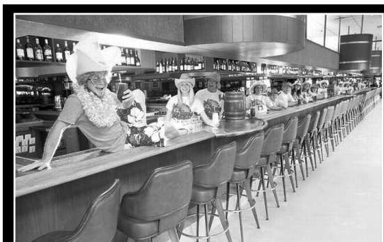
Beer Barrel Saloon абураб баралда бугеб стойкаялъул халалъи буго 123.7 метр.

КигIан гъараниги гъумер хIадур гъабичIо ПатIимат МахIмудоваль