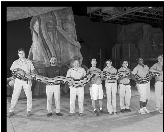
Дунялалда бицунго халатаб Пушистикилан абураб питоналъул халалъи буго 7.3 метр.