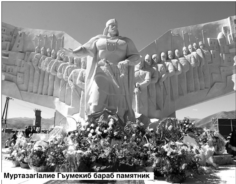
МуртазагIалие Гъумекиб бараб памятник

- ян абурал машгъураб аваразул халкъияб кочIол мухъал нахъе хутIана 270 соналъ цебе магIарул халкъалъ бихъизабураб бахIарчилъиялъул рахъалъ.