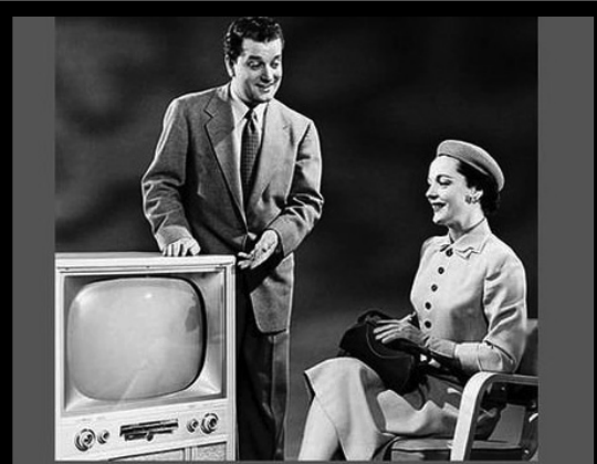
Чегларабги-хъахларабги телевидение бугеб мехалда камерабазда багларал филтрал хлалтлизарулел руклун руго. Гъелъ ведуциязул баглараб кьераль рельарал клутлби хъахлгарун рихъизарулаан. Гъединлъидал гъезул гланаби ва клутлби глурччинаб кьераль рельунаан.