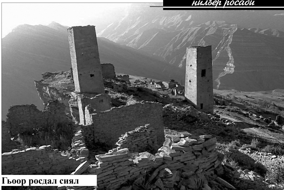
Гъоор росдал сиял

«Миллат» газеталъе хлажат вуго лъиклго авар мацл лълел ва компьютаралда хлалтлун бажарулел корреспондент ва газета биччалеб редактор . Харж къезе буго контракталда рекъон. Т.: 8 905 476 56 65.