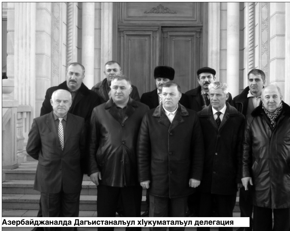
Азербайджаналда Дагъистанял хькуматалъул делегация

Закон ва хинкъигьечлөлъи цунуларев пачалихъалда бишунго ритлухъав диванчилъун хутлүлев вуго Калашников. Батияб нух жакъа бихьулел гьечло.