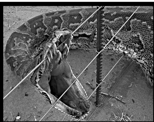
Питоналда клола тлубараб гланк киквине. Лъагалида жаниб гъел 150 глан глункикл кванала.