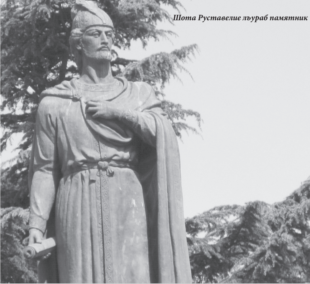
Шота Руставелие лъураб памятник

Грузиялгъул тахшагъаралде швани, нуж тІоцере ине кколел бакІал чанги руго. Раккизе бегъула Нарин-хъалаялде. Гъединго швечІого рес гъечІо дунялал-даго тІоцебе лъималазе гъабураб маххул