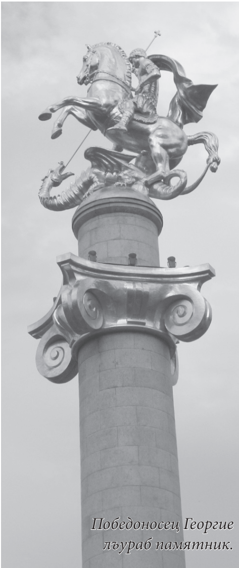
Победоносец, Георгие лъураб памятник.

нухалде. Гьеб нухгиха жалго лъималаца гъабураб буго, лъимал гурони гьенир хІалтІулелги рукІичІо. Ункънусго соналъ цебе гІуцІараб ботаникалъул ахикъеги ине бегъула. Амма гьенире хІухъбахъизе бакъ тІерхьиналде цере ине лъикІ буго.