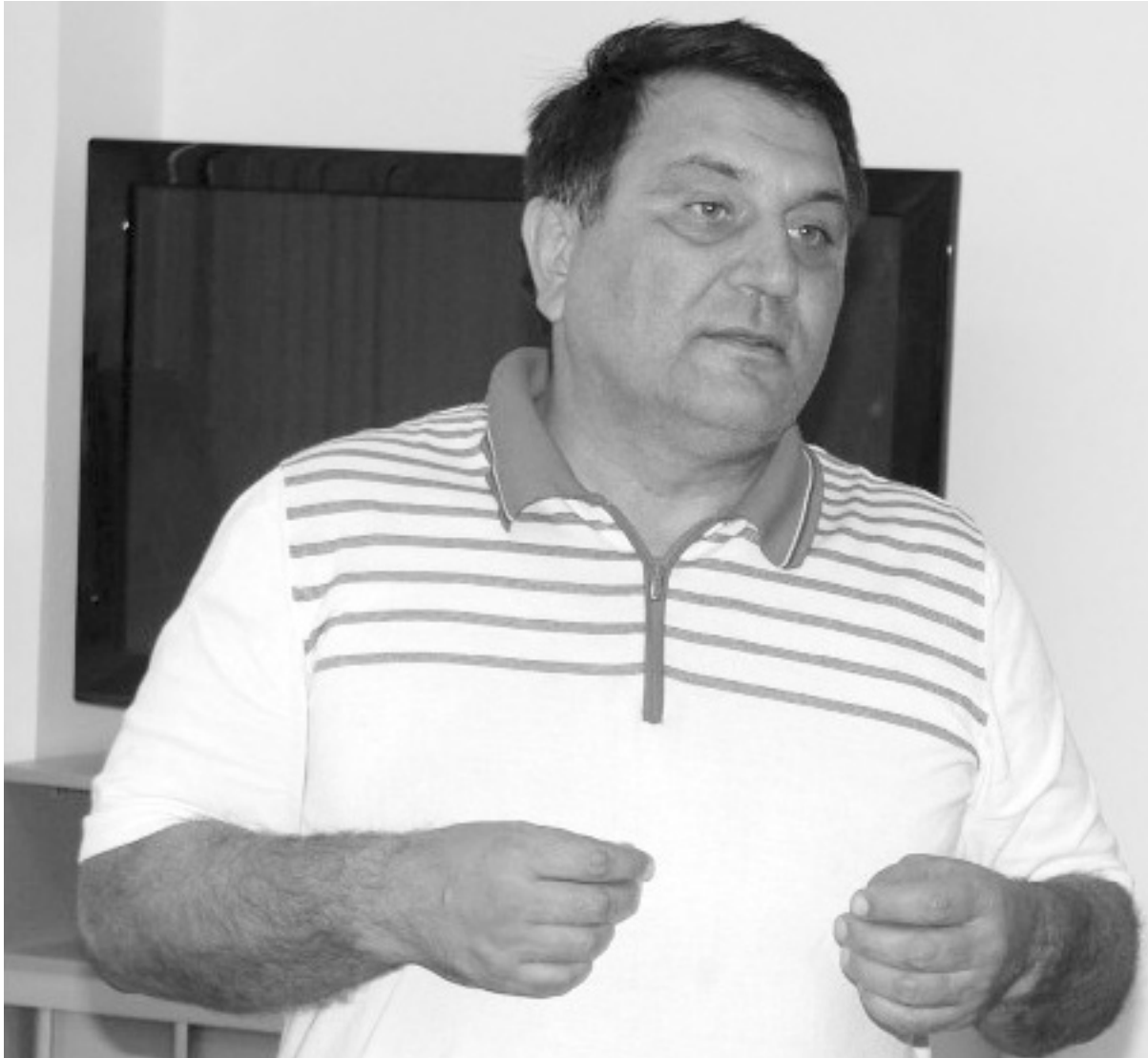
|| санагІат гъечІел суалал

Шивав жамгІиявгун политикайв хІаракатчиясул букІуна жиндирго хатІ, гІамалхасият, гІадамал жинда хадур цІаялъе чара гъечІого хІажатал рахъал – цоясул гІелмулъай, кІиабилесул – сихІирлъи, ай хІажатаб заманалда, хІажатаб бакІалда жидедаго гІадругел чагІазда аскІов вати, гъезие хъулухъалъе эхети, лъабабилезда гъаб дармил дунялалда лъикІго лъала лъихъа кигІан босизе ва лъие кигІан къезе колебали, гъеб гІелмуялъуна гІараде ва гъениб бакІ ккола гІемерал санаца. Амма руго жакъасеб Россиялъул политикаялда хасал политикал, гІицІго жидерго сурсаталда, гІарцуда, яргъида, къуваталда ва бекизабизе кІолареб хасияталда мугъчІвай гъабун хъулухъал ккурал, гъезул пикруялъухъ гІенеккичІого рес букІунаро бакІалъул гІалъиялъул, цо-цо мехалда федералияб централъулцин. Гъезул рахъалъ халкъалъул гІадатияб пикруги букІунаро, гъел рукІуна цоязе кумираллъун, кІиабилезе – тушбабилъун. Гъединаллъун рикІкІине бегъула Шималияб Кавказалъул политикаялъул Рамзан Къадиров, Сайгидпаша ГІумаханов ва Саид Амиров. Сайгидпаша ГІумахановгъевкІигоясдагибатІияв вуго, Рамзаницагун Саидица Москваялъе - Пу-