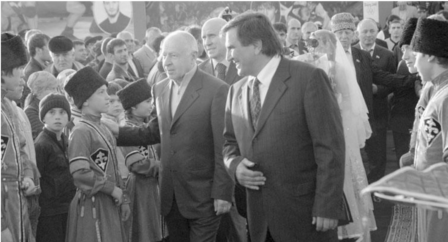
ГІелмуги къуватги цоцазда аскІоб, гъeб кІиябго къурав цевехъан ани...

рулав вуго, дие гьелъ асар гъабулебги батила, амма бокъарав вацІІадав, чияр асаралда гъорлъ унарев, бихьинчи-яб хасияталъул ритІухъав президент вачІани дица гьесул щиб миллаталъул чи вугониги рахъ кквела. Гьeб дуца абулеб миллатчилъи абураб рагІиги Геме-рисеб мехалда жиндир миллаталъул тІалабги гъабулев, гьел ГІодорегІан гъаризеги толарев бокъарав чиясда далулеб ярлык буго. Гьединго жиндир миллатги бичун, бокъараб тІалъиялда гъоркь регулел, жиндир чохъолгун гІагарлъиялъул тІалабазда чІарал хІелхІелчагІазда абула «интернационалистадин». Миллатги бичун, жакъа «интернационалистлъи» хІазе дун вахъани, диеги щола хъулухъал, дие гьедин инжитго щвараб тахбакІ хІажат гъечІо, хъулухъ гъечІев чи гуро дун гъадинги, амма дир миллаталъул тІалабалдаса ва гьелъул къадру цІуниялдаса кІвар бугеб масъала дир Гумруялъулъ цойги бихъуларо.