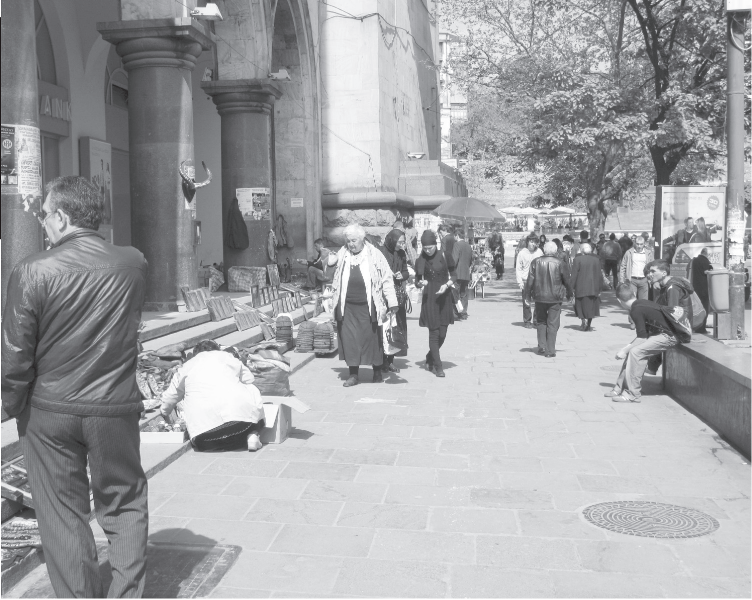
Сувенирал, ай сайгъатал, учузго росизе бегъула Шота Руставелил къотІноб.

Россиялгъул ГІорхъи цІунулезде данде гуржиязул ГІорхъи цІунулел ма-лаикзабилгъун рихъула. Гьел кІалгъаларо хъачІго, кьоларо гІантал суалал. Загран-