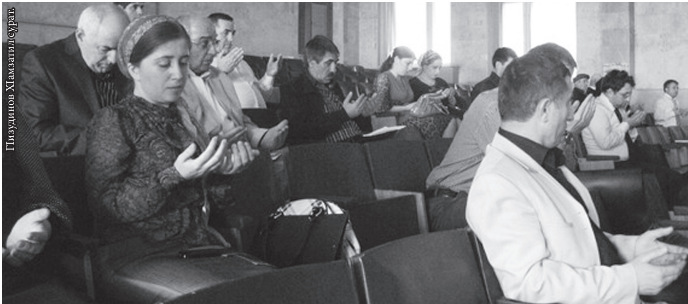
ХъахІаб рукъ разияб тадбир - аваразул гІелмияб ва интеллектуالياб «элита» дугІа-алхІамалда...

Аваразул масъалаби гъоркъор лъезейин гъоркъисала ноябралдаса нахъего хІадурелеб букІараб конференция МахІачхъалаялда 26 майда тІобитІана. Амма раклалдаго гъечІого гъеб кІийиде бикъана.